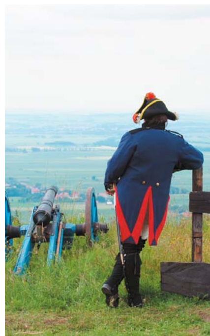
Pohled z městské bašty.