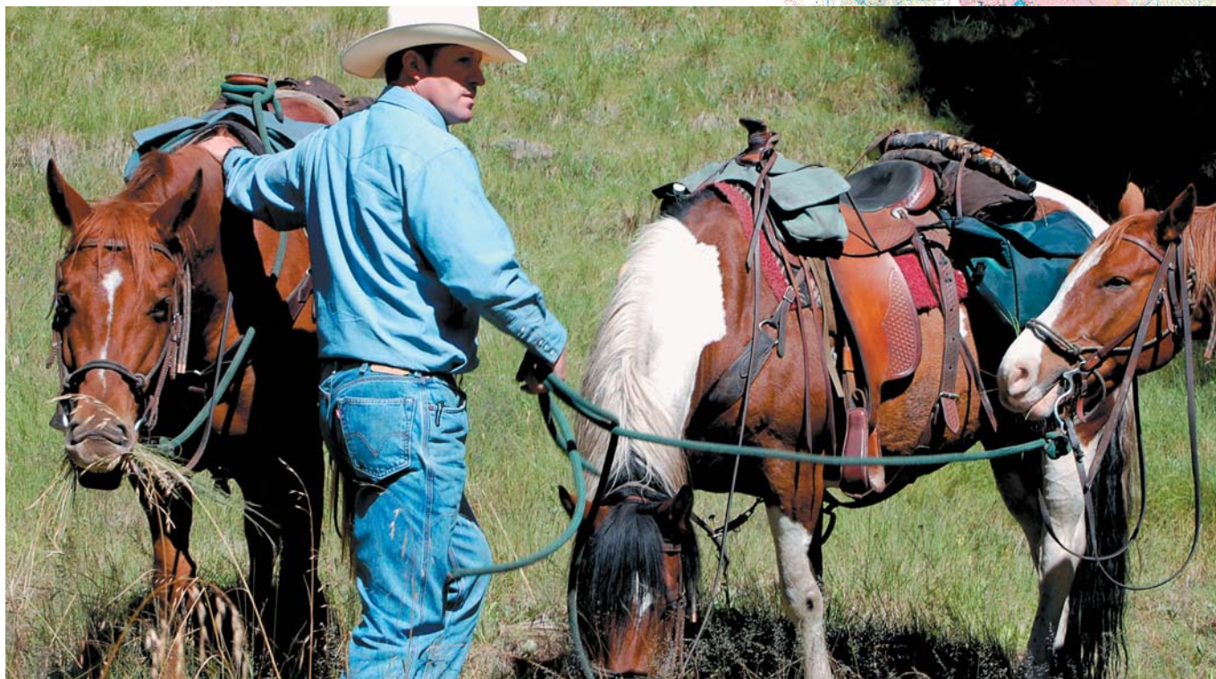
Sám, s přáteli nebo s celou rodinou - klusem do Česka – otevřené hranice dávají větší možnosti cestování