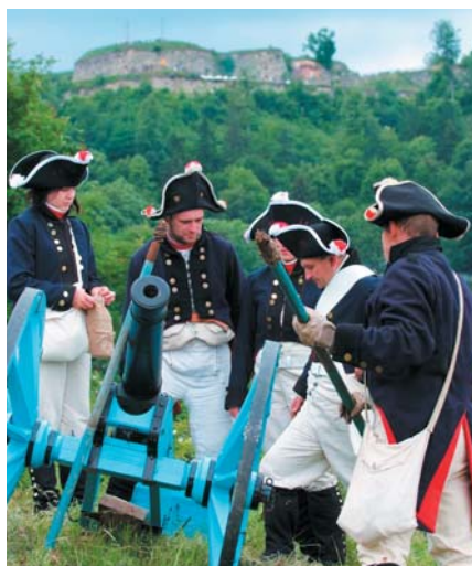
Regiment Stříbrná hora - dělostřelectvo s librovým dělem.

V gmině Stoszowice se nachází jedna z největších zajímavostí regionu - pevnost Stříbrná hora, což je pravděpodobně největší horská pevnost v Evropě. Navštívili jsme tuto pevnost se zájmem připravit reportáž z místa, které je českým turistům zatím tak trochu utajeno asi 209 kilometrů severně od Klodzka. Žádnou hlavní silnicí se ale k pevnosti nedostanete.