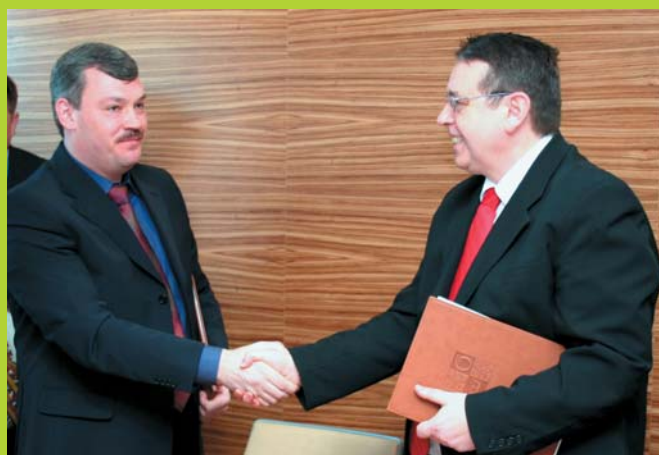
Premiér Čuvašské republiky Sergej Galplikov a hejtman Luboš Franc po podpisu smlouvy o spolupráci 3.4.2009.