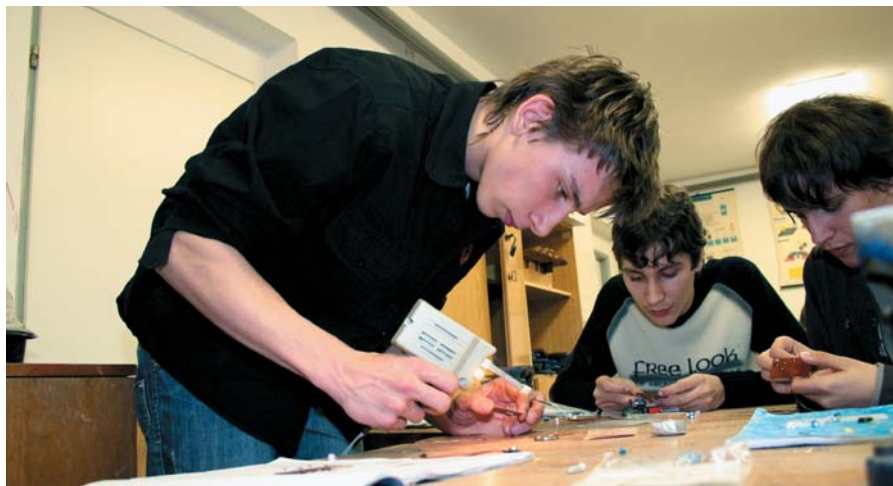
Žáci Základní školy a mateřské školy v Častolovicích při realizaci projektu Volba povolání.