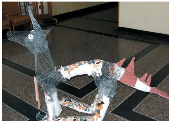
Soutěžní práce žáků Masarykovy ZŠ a MŠ Hradec Králové - Plotiště

Připravili jsme nový projekt 10 lekcí techniky