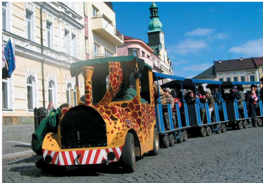
Během vítání jara jezdil dětský vláček nonstop mezi rychnovským náměstím a pivovarem.

V objektu uskutečnilo již několik divadel-