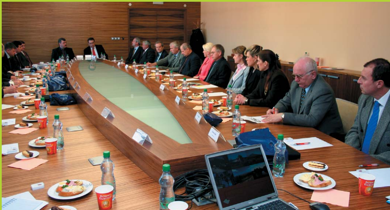
Představitelé firem Královéhradeckého kraje společně s představiteli kraje na jednání s premiérem Čuvašské republiky.